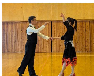
フォローリーダーも真剣