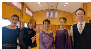
ほっとした笑顔 最高！