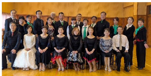
受験者と役員の皆様

11月2日（日）塩尻市堅石区民センターにて第39回技術認定会が行われ、8名が受験しました。緊張感の漂う中、自分の成長の確認や今後の課題発見の為、真剣に取り組んでいました。踊り終えた皆様の表情には満足感が伺えました。