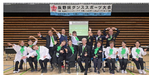
少数精鋭の実行委員