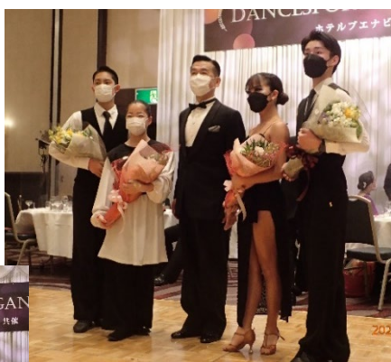
優秀選手賞受賞者