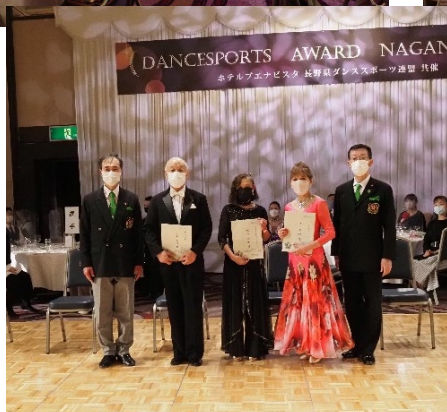
技術認定試験に挑戦・合格された皆さま