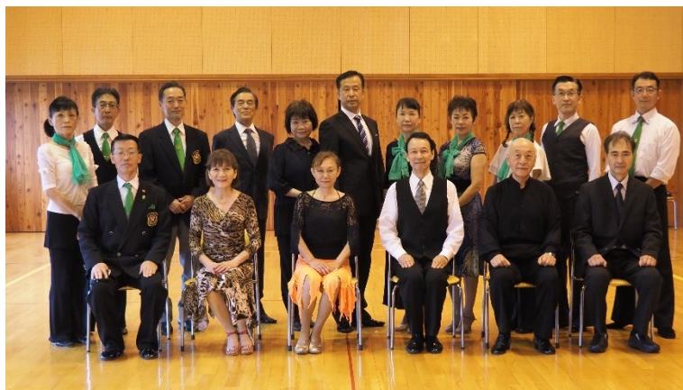
第 33 回技術認定会