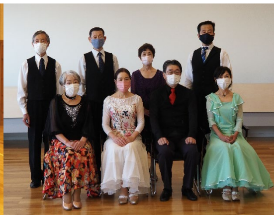
第 34 回技術認定会